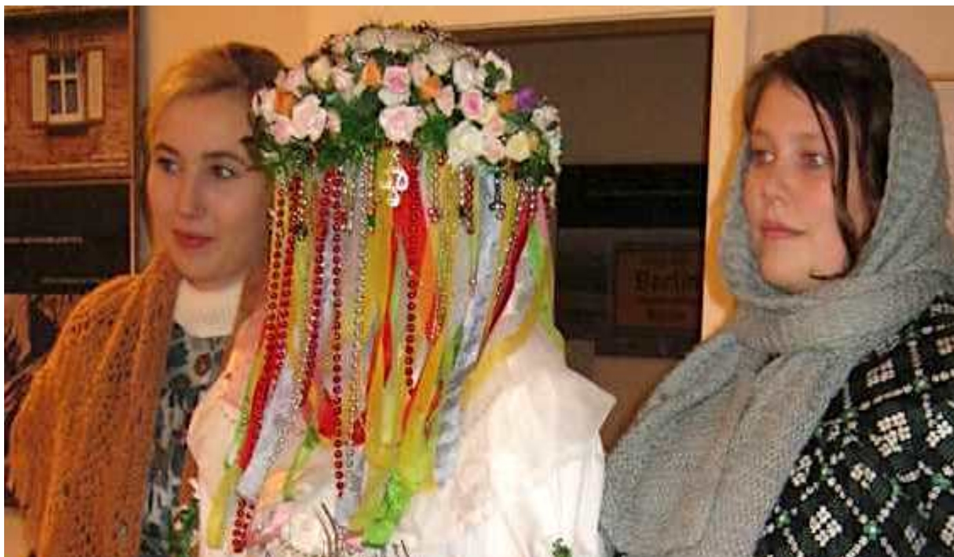
Janšowski bog (Jänschwalder Bescherkind)